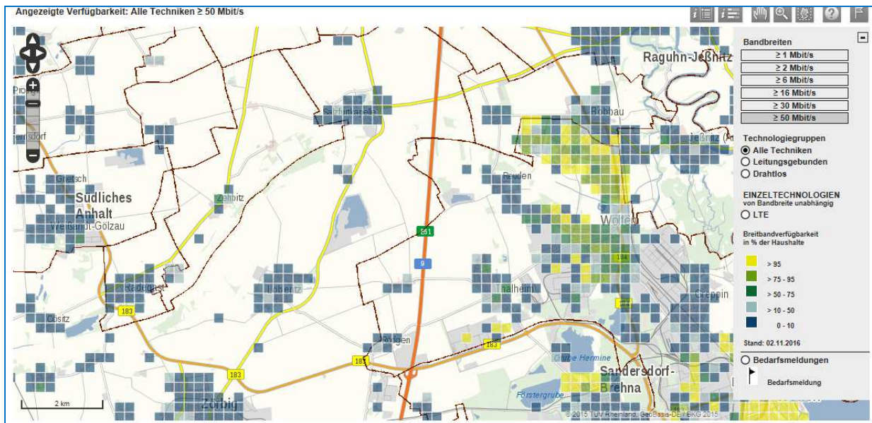
Nördliches Stadtgebiet von Zörbig